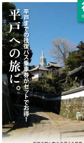
平戸寺院と教会の見える風景